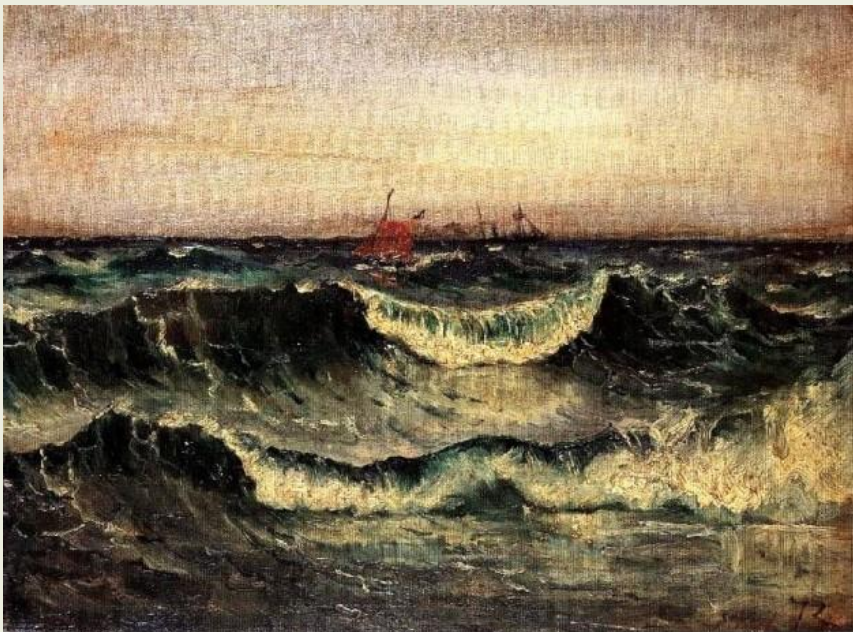
Εικόνα 1 ΑΦΡΙΣΜΕΝΗ