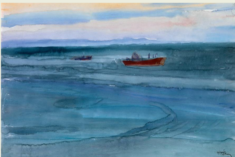
Εικόνα 2 ΑΝΟΙΧΤΗ