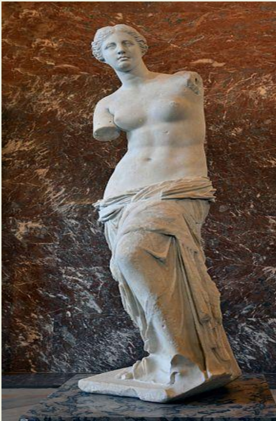
Η θεά Αφροδίτη

Οι εικόνες του αινίγματος είναι οι εξής: