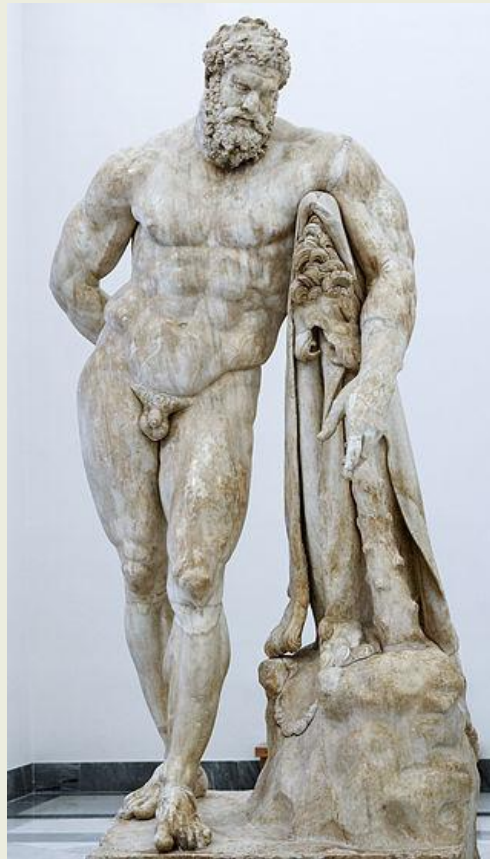
Ο ήρωας Ηρακλής