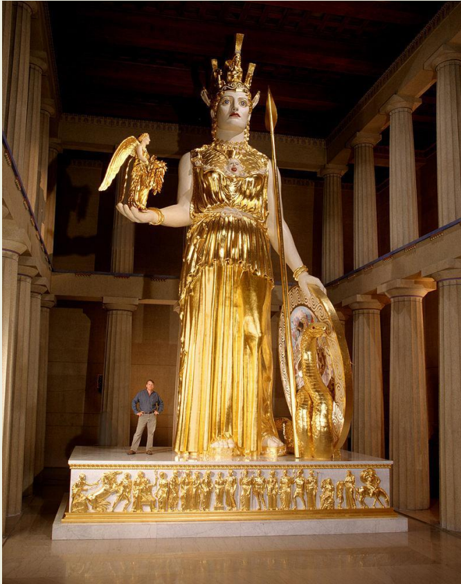
Η θεά Αθηνά

Βήμα 2: Οι μαθητές/-τριες, που ακούν στα ελληνικά τις οδηγίες, βρίσκουν τις εικόνες με τη σειρά που είναι αριθμημένες. Πίσω από κάθε εικόνα υπάρχει κάποιος αριθμός. Πίσω από την εικόνα της θεάς Αφροδίτης υπάρχει ο αριθμός «3», πίσω από την εικόνα του ήρωα Ηρακλή ο αριθμός «2», πίσω από την εικόνα του ποιητή Ομήρου ο αριθμός «9», πίσω από την εικόνα του θεού Διονύσου ο αριθμός «9» και πίσω από την εικόνα της θεάς Αθηνάς ο αριθμός «3». Αν τους βάλουν με τη σειρά που έχουν βρει τις εικόνες, θα σχηματίσουν τον κωδικό «32993». Με αυτόν τον κωδικό θα ξεκλειδώσουν στον φορητό υπολογιστή την επιφάνεια χρήσης του χρήστη «Επόμενο αίνιγμα», που θα τους οδηγήσει στο επόμενο αίνιγμα.