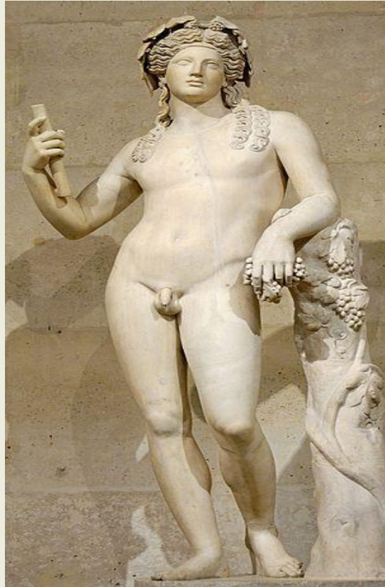
Ο θεός Διόνυσος